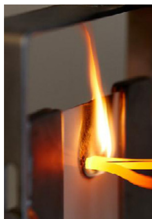
UL94 Brandtest