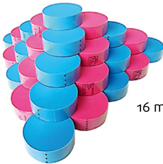
16 mm kurze Schnitte

In unserem hochmodernen Schneidzentrum können wir kurze Schnitte von gerade einmal 16 mm mit horizontalem Druck realisieren, sodass schwierige Produktkennzeichnungen nun der Vergangenheit angehören. Die geringe Schneidtoleranz von +/- 0,15 mm sorgt für die Präzision, wie Sie sie für Ihren Tuftingprozess benötigen.